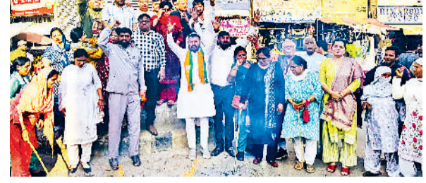
रोहताक। पुतला दहन कर प्रदर्शन करते भारतीय जनता पार्टी के जिला कार्यकर्ता।