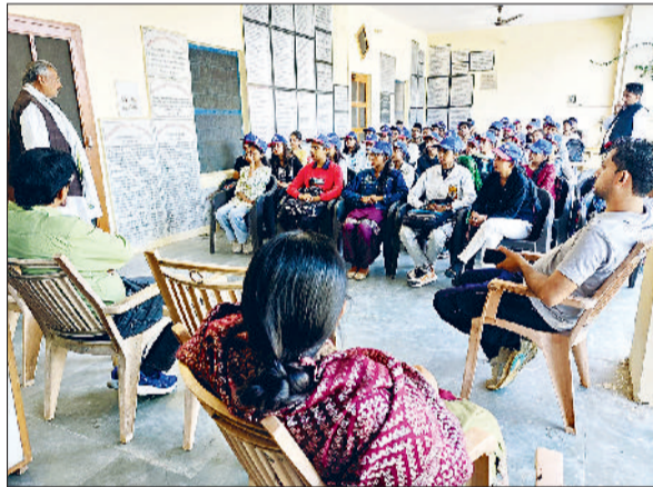
रोहतक। स्वयंसेवकों को संबोधित करते पहरावर स्थित गोशाला सचिव।