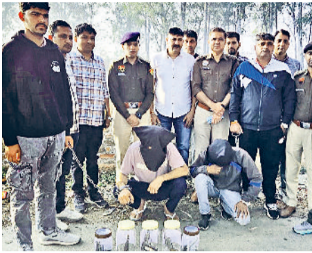
पकड़े गए आरोपित सीआई की टीम के साथ।