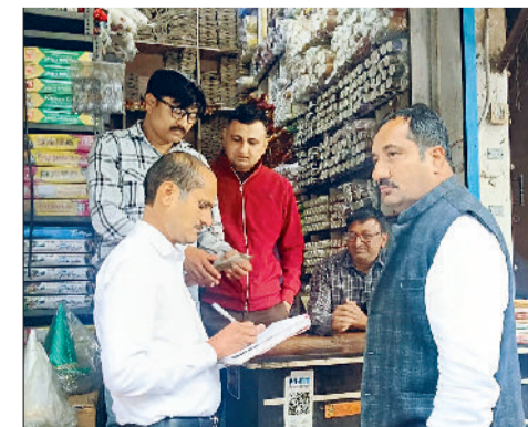
रोहतक। दुकानदार को चालान काटते नगर निगम की टीम।

स्वच्छ सर्वेक्षण-2025-26 को लेकर नगर निगम ने सख्त रुख अपनाते हुए शहर में विशेष अभियान चलाया। निगम आयुक्त डा. आनंद कुमार शर्मा की अध्यक्षता में आयोजित समीक्षा बैठक में सफाई व्यवस्था को लेकर अधिकारियों और कर्मचारियों को स्पष्ट निर्देश दिए गए कि शहर में गंदगी किसी भी स्तर में बर्दाश्त नहीं की जाएगी और नियमों का उल्लंघन करने वालों के चालान सुनिश्चित किए जाएंगे। निरीक्षण अभियान के दौरान निगम टीम ने माल गोदाम रोड, बाबरा बाजार और पुरानी सब्जी मंडी सहित विभिन्न बाजार क्षेत्रों में औचक जांच की। इस दौरान सिंगल यूज प्लास्टिक बेचने वाले 5 दुकानदारों के 22,000 रुपये के चालान किए गए, जबकि गंदगी फैलाने पर 2 लोगों के 1,500 रुपये के चालान काटे गए। कुल मिलाकर 23,500 रुपये की कार्रवाई की गई। टीम ने दुकानदारों, रेहड़ी-फड़ी संचालकों और आमजन को प्रतिबंधित प्लास्टिक के नियमों की जानकारी दी। साथ ही गीले और सूखे कचरे को अलग-अलग एकत्रित करने तथा कचरे को निर्धारित डस्टबिन में ही डालने की अपील की गई।