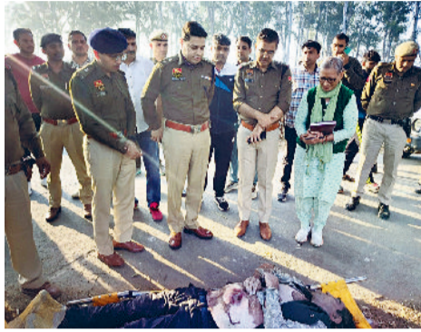
रोहतक। शव की जांच करते एसपी व अन्य पुलिस अधिकारी।

कुछ लोग दहशत फैलाने के लिए ल रहे थे काला राठी गैंग का नाम