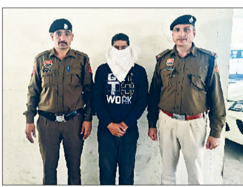
रोहतक। आरोपित पुलिस की गिरफ्त में।